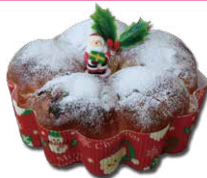
ノンアレケーキ台 787円