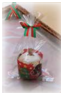
ノンアレ クリスマス カップ