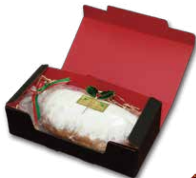
クリスマスシューレン 1,260円