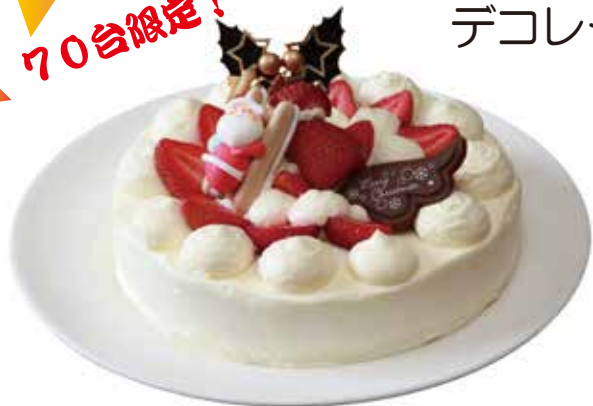
デコレーションケーキ