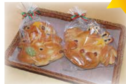
ノンアレクリスマスパン (ツリー・トナカイ) 各378円